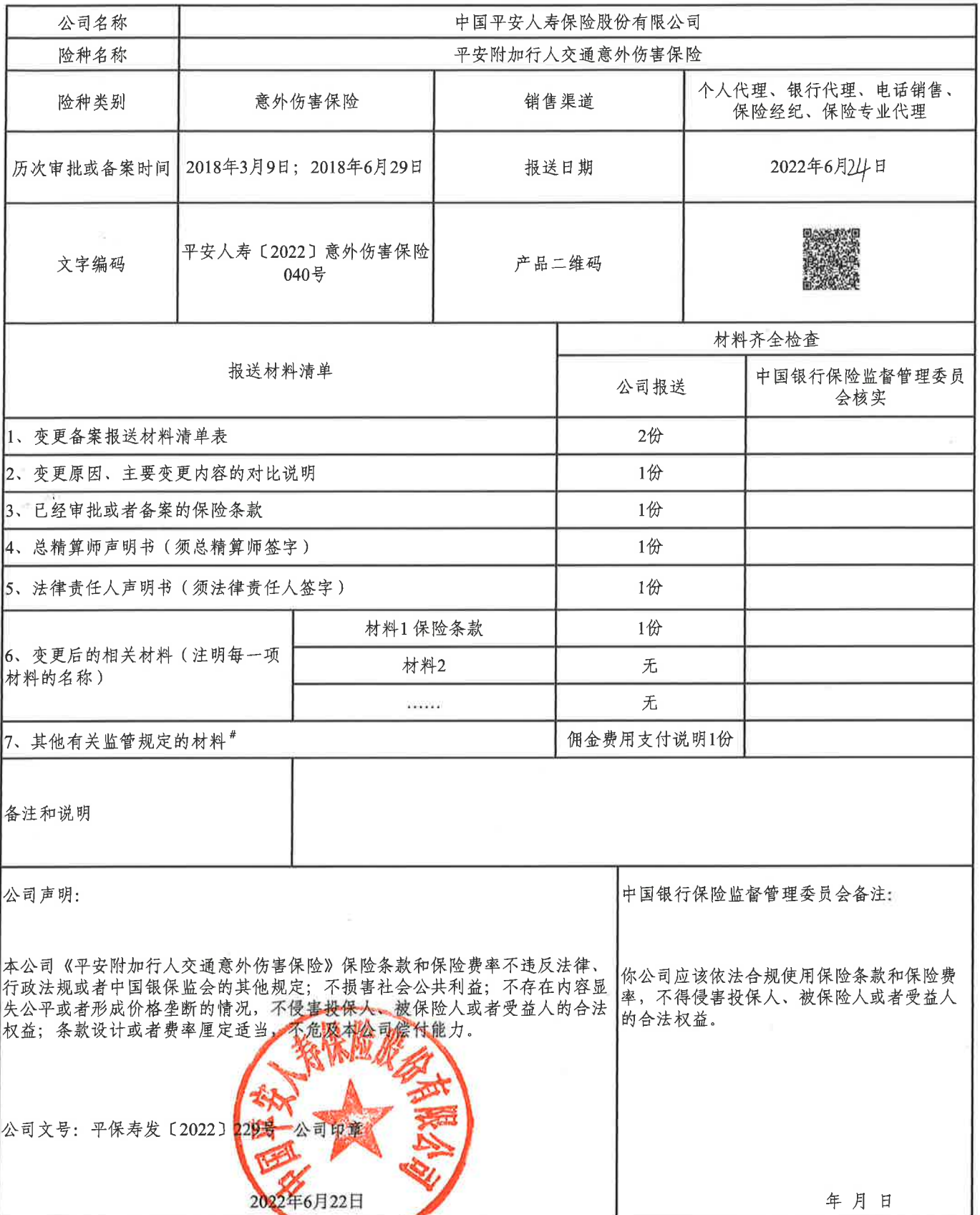
变更备案报送材料清单表