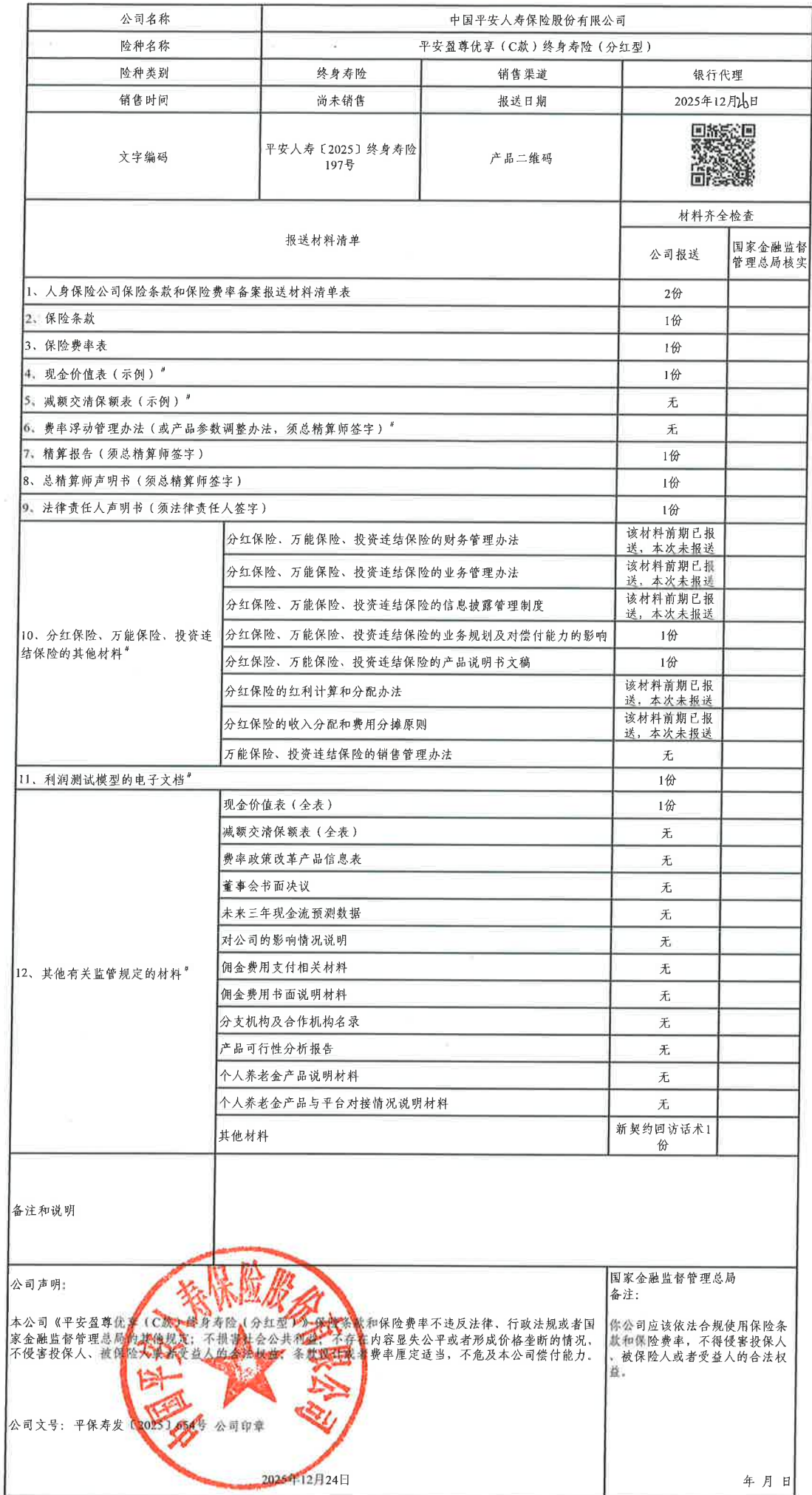
人身保险公司保险条款和保险费率备案报送材料清单表